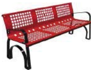
Rojo RAL. 3020