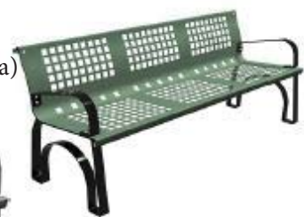
Verde RAL. 6002

Color a elegir sin coste adicional. Tambien disponible en color gris oscuro(forja)