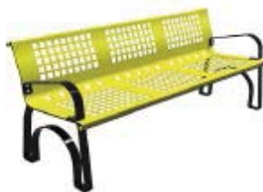
Amarillo RAL. 1003

Color a elegir sin coste adicional. Tambien disponible en color gris oscuro(forja)