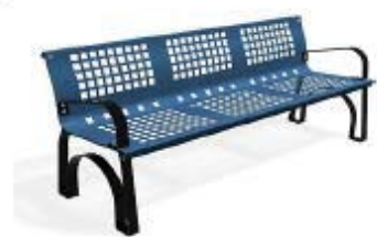
Azul RAL. 5015