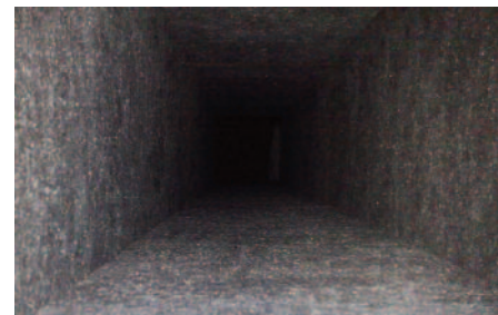
Climacoustic después de someterlo a 20 ciclos de limpieza