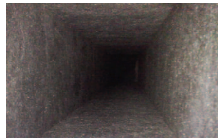
Climacoustic antes de someterlo a limpieza interior