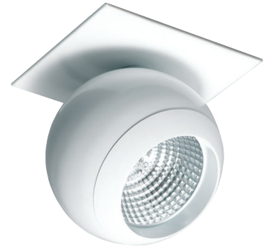
ESFERA Downlight semiempotrar Ver capítulo Downlights orientables