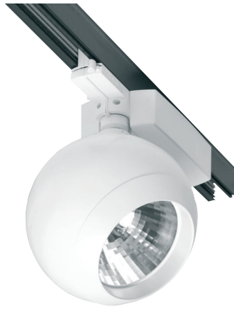
ESFERA Proyector Ver capítulo Proyectores