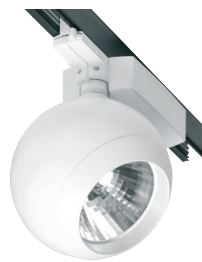
ESFERA Projector Ver capítulo Proyectores