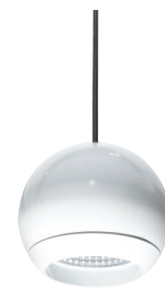
ESFERA Colgante Ver capítulo Luminarias Pendulares