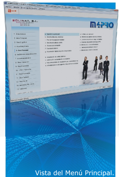
Vista del Menú Principal.