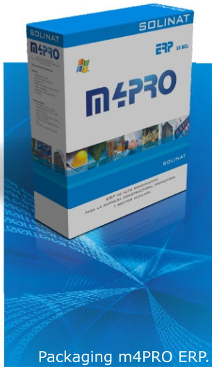
Packaging m4PRO ERP.