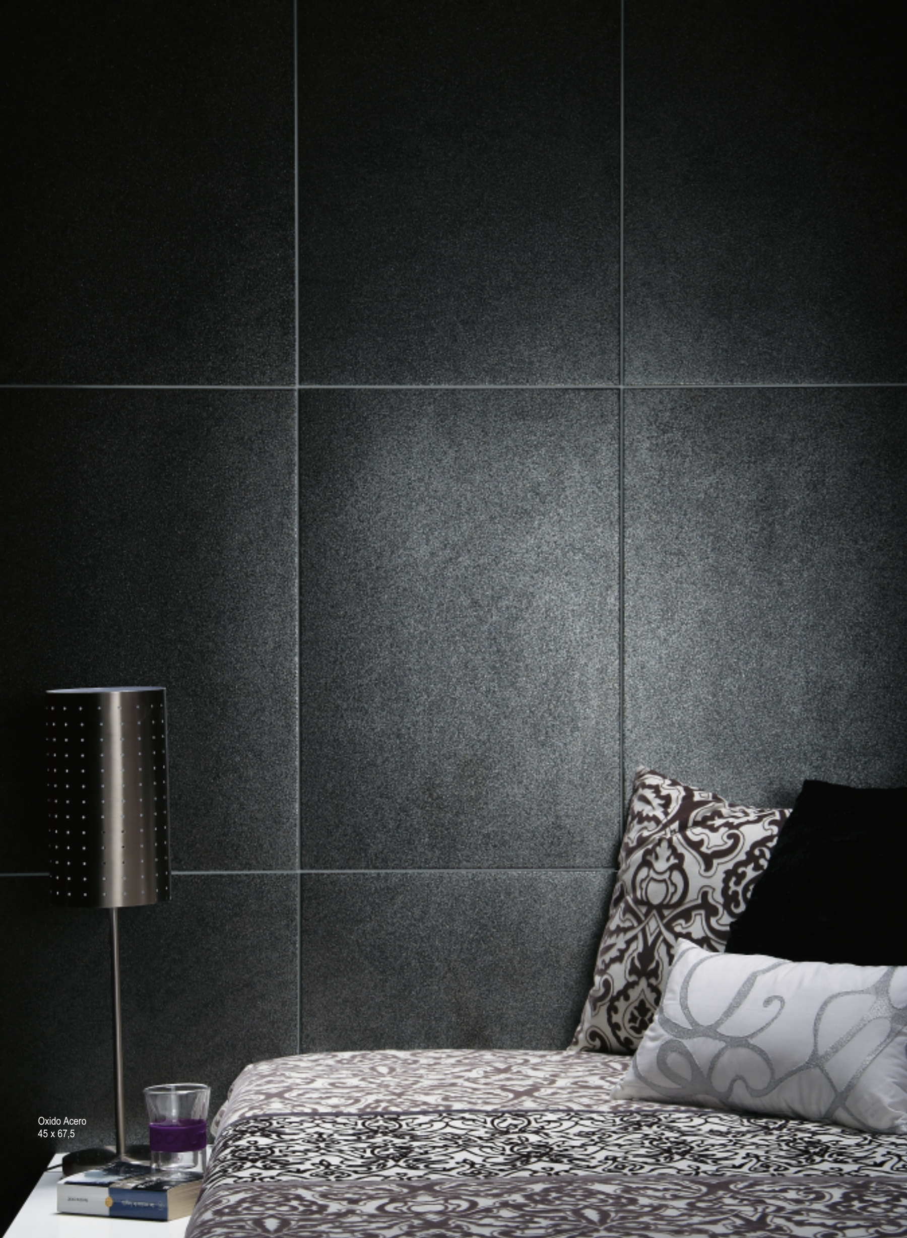
Oxido Acero 45 x 67,5