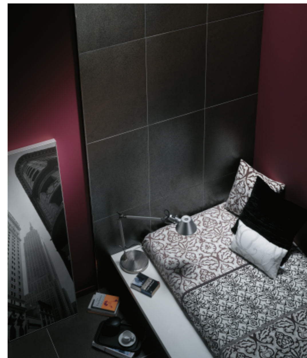
Oxido Acero 45 x 67,5