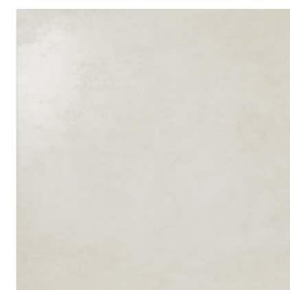
Cemento Blanco 60 x 60 141 .....