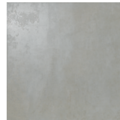
Cemento Gris 60 x 60 141 .....