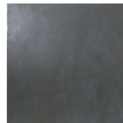
Cemento Negro 60 x 60 141 .....