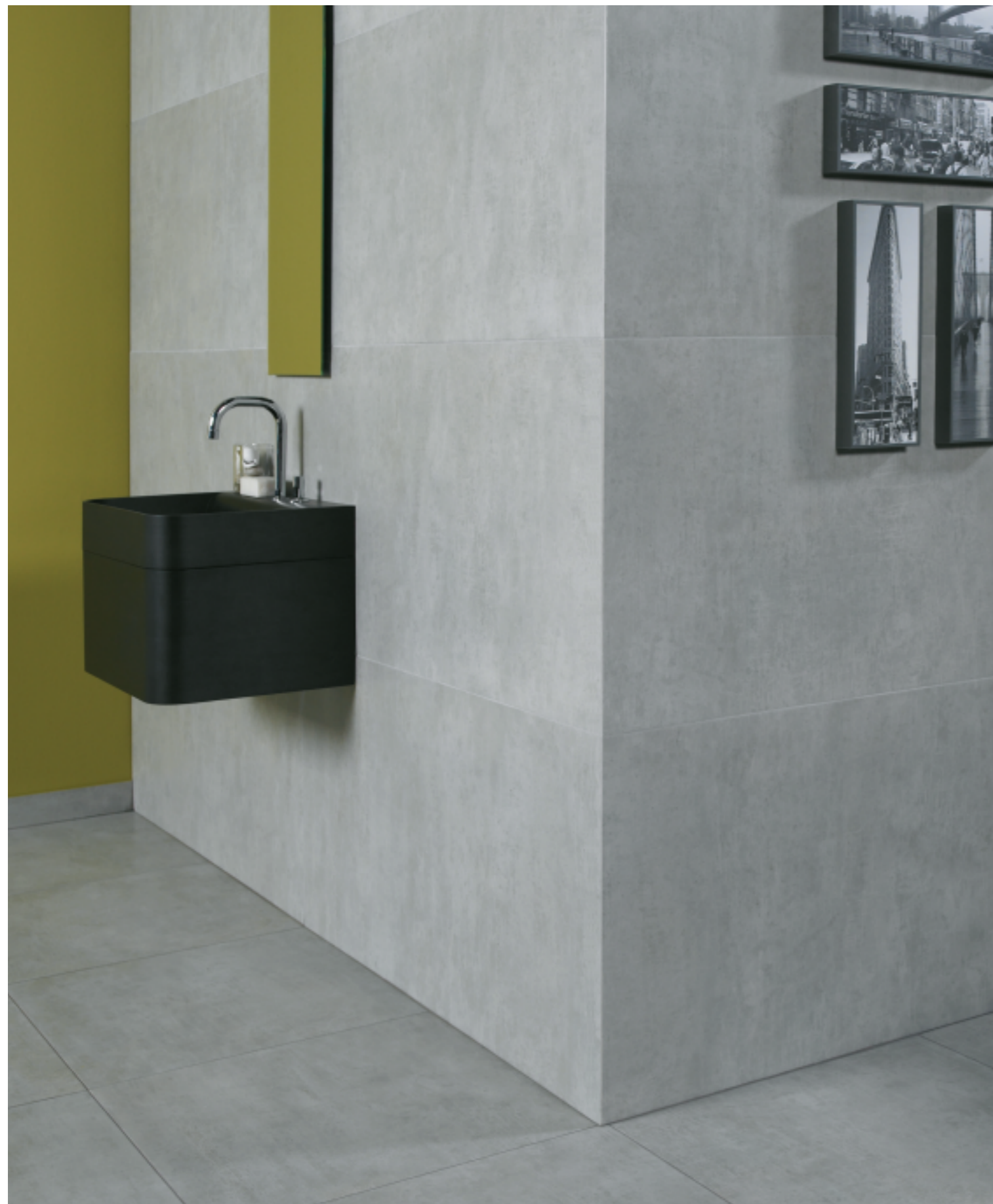
Cemento Gris 60 x 120 / Cemento Gris 60 x 60 / Rodapié Cemento Gris 9 x 60

Espesor/Thickness Pieza/Piece 60 x 120: 12 mm. > Pieza/Piece 60 x 60: 11 mm.