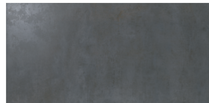
Cemento Negro 60 x 120 152 .....