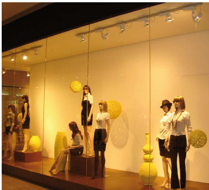
Nichii Fashion Boutique - Pavilion KL, Kuala Lumpur (Malaysia)