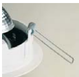
Muelle de fijación de acero Steel spring retention