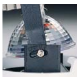
Facil incorporación de accesorios Easy fitting attachment.