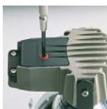
Cuerpo de aluminio y conexión de seguridad Safety terminal connection box