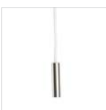
Con tirador niquelado de 1 encendido Nikel single position pull switch