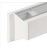
Reflector de aluminio y difusor de policarbonato Aluminium reflector and polycarbonate diffuser