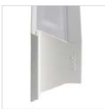
Cuerpo de aluminio y tapas finales de policarbonato Aluminium body and polycarbonate end covers