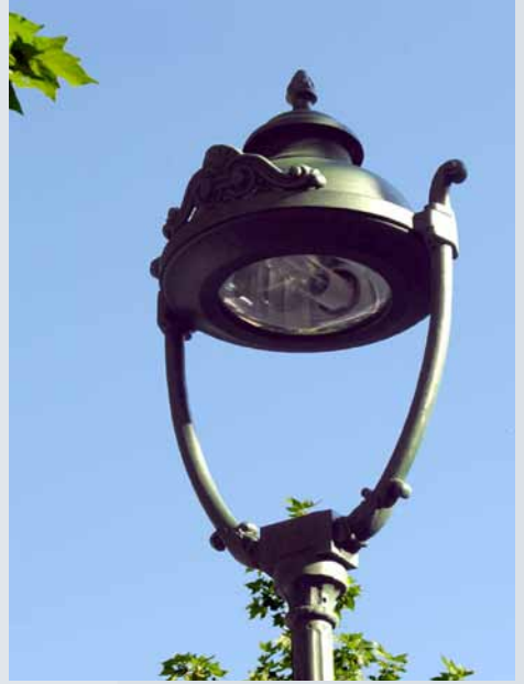
Lira de tamaño medio inspirada en los diseños clásicos de principios de siglo XX.