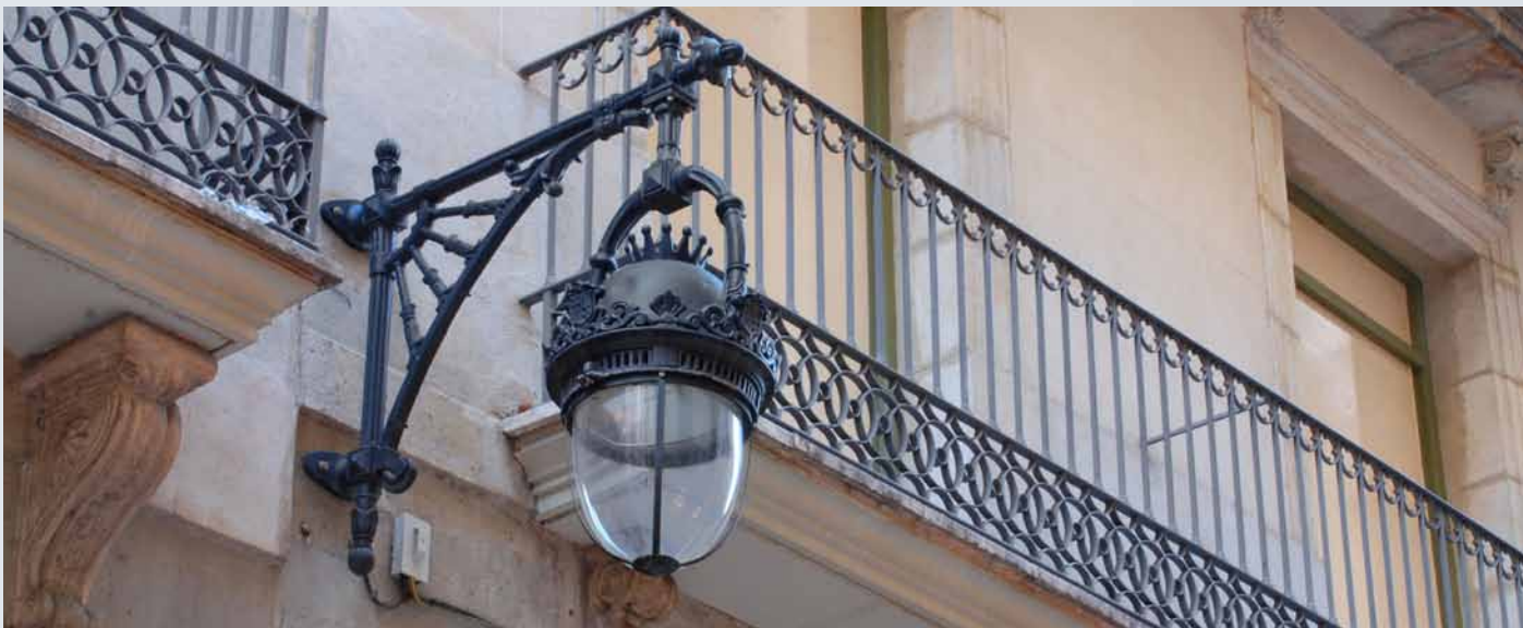
Lira clásica colgante, ideal para montar en repisa. En fundición de aluminio con difusor esférico de policarbonato.