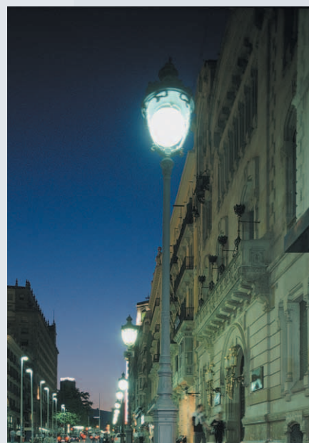
Lira de grandes dimensiones inspirada en los diseños clásicos de principios de siglo XX.