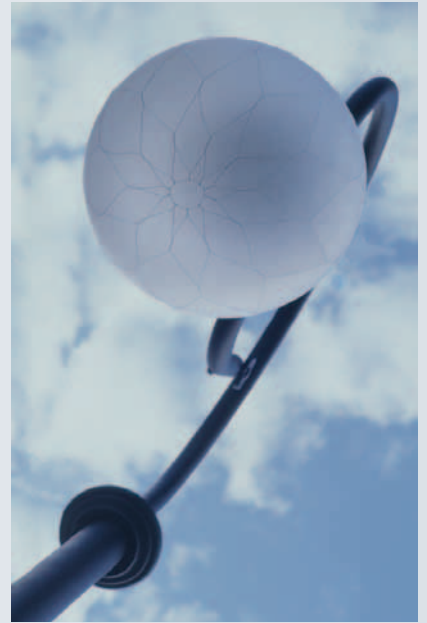
Luminaria suspendida de corte clásico inspirada en los primeros faroles de gas.