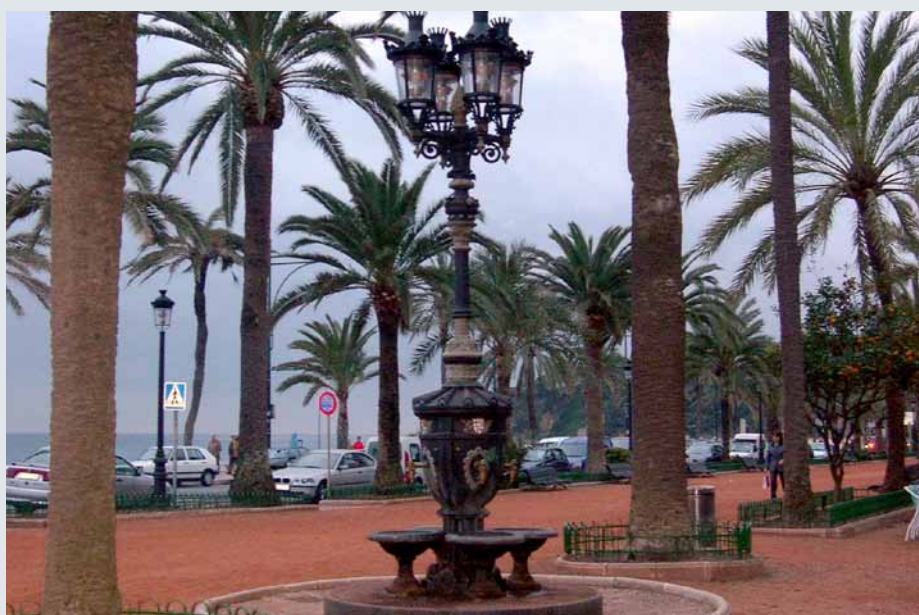
Fuente monumental con grifos a los cuatro vientos de 4.8m de altura, culminada con crucetas de 4 luminarias Atenea. Fabricada en fundición de hierro gris y aluminio.