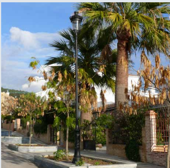
Clásica muy popular en 3 versiones para varias alturas desde 3 a 5m.