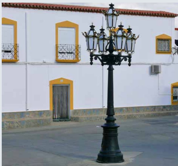
Conjunto emblemático con 5 luminarias para entornos de prestigio. Realizada en fundición de hierro y aluminio.