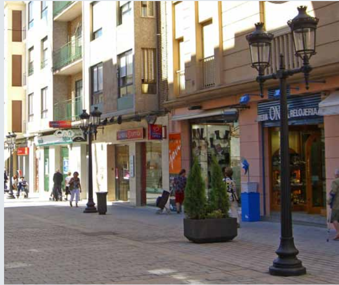
Clásica de estilo americano de 3.2m de altura, con base robusta. En fundición de hierro y aluminio.