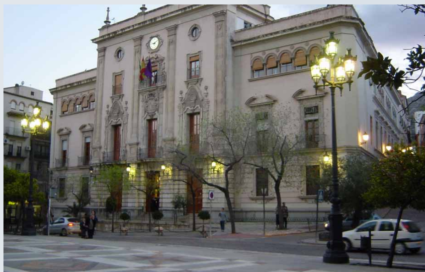
Clásica de gran altura de perfiles muy labrados en detalles, para plazas o grandes avenidas. Columna en fundición de hierro y brazos de aluminio.