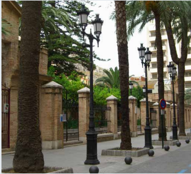
Serie esbelta de gran altura, 4.5m. Fabricada en fundición de hierro.