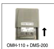
OMH-110 + DMS-200