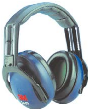
CE EN 352-1 1445

Orejera con arnés almohadado en la zona interior. Almohadillas suaves con forma anatómica que mejoran el sellado del pabellón auditivo. Ajuste lateral y vertical. Peso: 225g SNR=27 dB H=31 M=24 L=16 Kit de higiene Ref. 1442