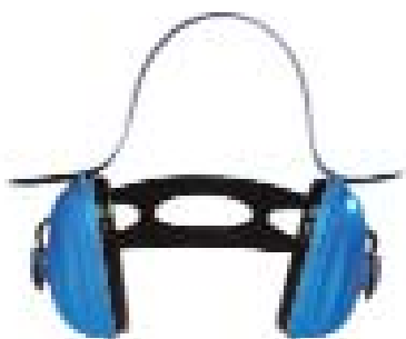
CE EN 352-1 1435

Orejera con arnés de doble posición: cabeza y nuca. Permite uso simultáneo con un casco de seguridad. SNR=23 dB H=31 M=20 L=13