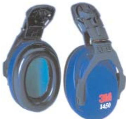
CE EN 352-3 1455

Orejera para acoplar directamente al casco 3M. 3 posiciones: trabajo, descanso y parada. Peso: 225g SNR=26 dB H=29 M=23 L=15 Kit de higiene Ref. 1442