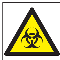
REF. 393 PELIGRO BIOLÓGICO