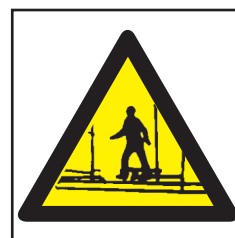
REF. 317 PELIGRO ANDAMIO INCOMPLETO