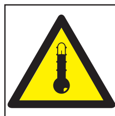
REF. 315 PELIGRO ALTA TEMPERATURA