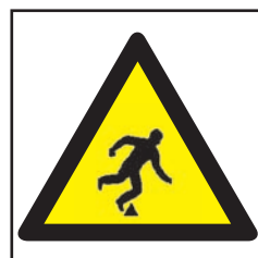
REF. 387 CAÍDAS MISMO NIVEL