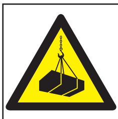
REF. 340 PELIGRO CARGA SUSPENDIDA