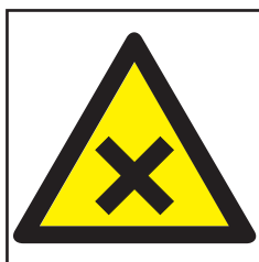
REF. 390 MATERIAS NOCIVAS E IRRITANTES