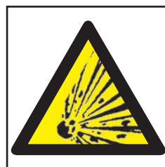
REF. 335 PELIGRO DE EXPLOSIÓN