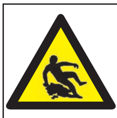
REF. 395 PELIGRO SUELO RESBALADIZO