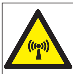
REF. 322 PELIGRO RADIACIÓN NO IONIZANTE