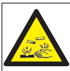
REF. 350 PELIGRO CORROSIÓN