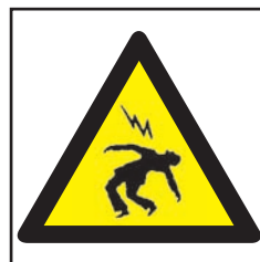
REF. 345 PELIGRO RIESGO ELÉCTRICO