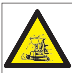
REF. 360 MAQUINARIA PESADA