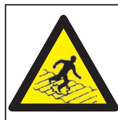
REF. 394 PELIGRO ESCALERA