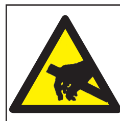
REF. 327 PELIGRO CORRIENTE ESTÁTICA