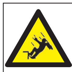
REF. 355 CAÍDA DISTINTO NIVEL