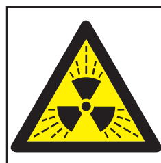
REF. 325 PELIGRO RADIACIÓN