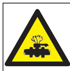
REF. 305 PELIGRO ALTA PRESIÓN