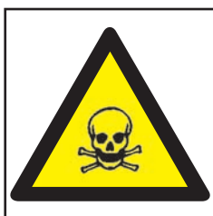
REF. 310 PELIGRO INTOXICACIÓN