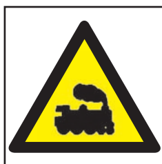
REF. 312 PELIGRO PASO TREN O VÍAS