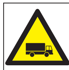
REF. 307 PELIGRO CAMIONES