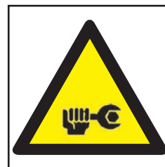
REF. 347 PELIGRO HOMBRES TRABAJANDO EN MÁQUINA