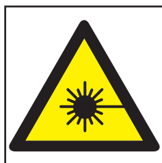
REF. 391 RADIACIONES LÁSER