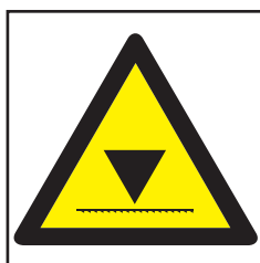
REF. 302 PELIGRO CARGA SUPERIOR LIMITADA