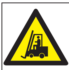
REF. 380 PELIGRO PASO DE CARRETILLAS