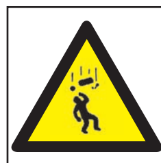
REF. 357 CAÍDA DE OBJETOS