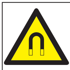
REF. 396 PELIGRO ZONA MAGNÉTICA