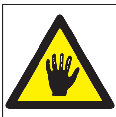
REF. 330 PELIGRO CORROSIÓN