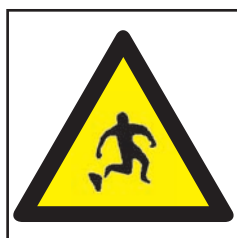
REF. 352 PELIGRO CUIDADO CON EL ESCALÓN