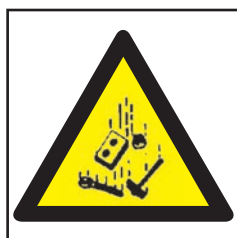
REF. 365 CAÍDA DE OBJETOS