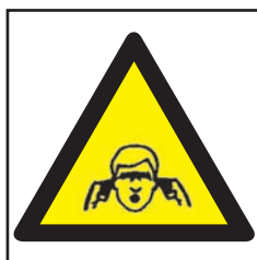
REF. 332 PELIGRO RUIDO