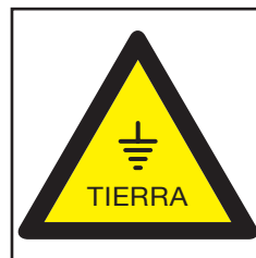
REF. 399 TOMA DE TIERRA