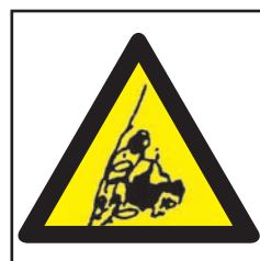
REF. 370 PELIGRO DE DESPRENDIMIENTO