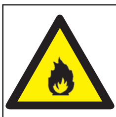
REF. 320 PELIGRO INCENDIO