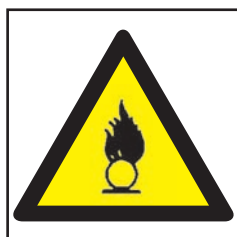
REF. 385 PELIGRO MATERIAL COMBURENTE