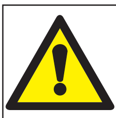
REF. 300 PELIGRO