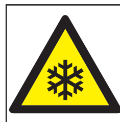
REF. 336 BAJA TEMPERATURA