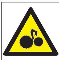
REF. 342 PELIGRO MÁQUINA EN MOVIMIENTO