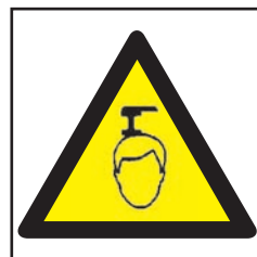
REF. 398 PELIGRO OBJETOS FIJOS A BAJA ALTURA