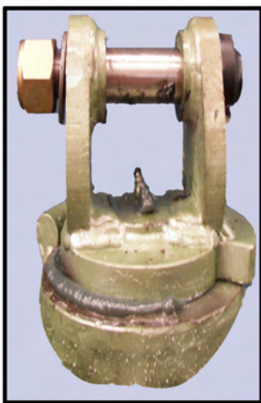
GIRO MECÁNICO DE TOPE