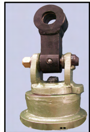
GIRO MECÁNICO DE TOPE (CON ACOPLÉ)