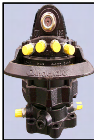
ROTATOR GIRO CONTINUADO