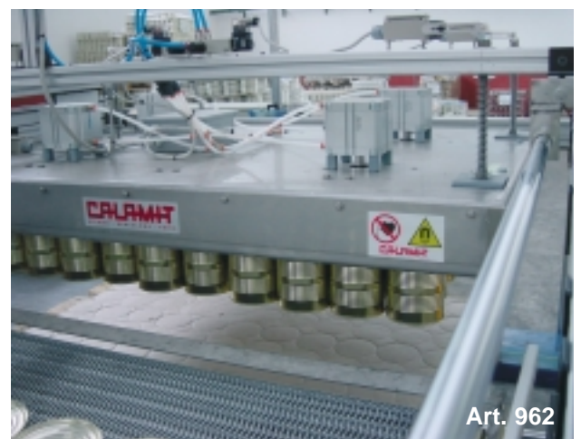
Depaletizzatore magnetico permanente Depaletizador magnético permanente Dépalettiseur magnétique permanent Permanent magnetic depalletiser