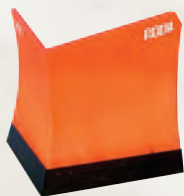
Lámina quitanieve en forma de "CUÑA O TRIANGULO".

Compuesta por una sola pieza monoblock sin posibilidad de movimientos. Apta para ser empujada en carreteras de acceso particulares.