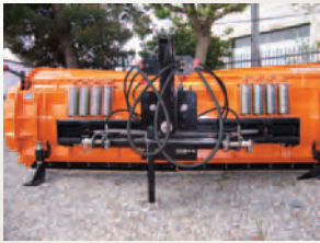
Lámina quitanieve en forma de "teja".

Dispone de movimiento hidráulico para el barrido izquierdo-derecha. Apta para ser empujada sobre pistas forestales, carreteras tanto comarcales como nacionales y aeropuertos.