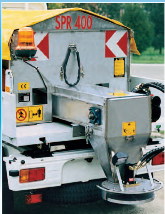
Versión con estructura en acero INOX AISI 304