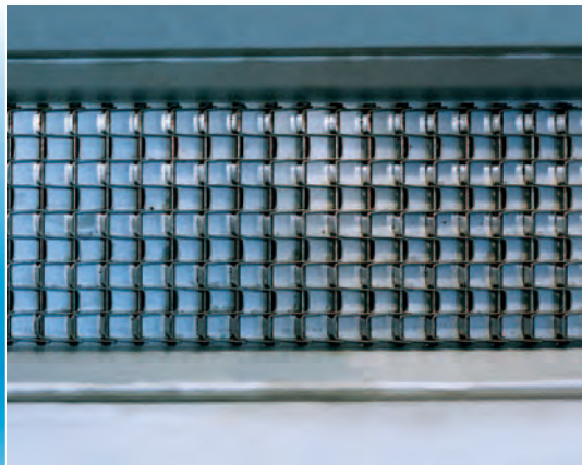
Alimentación por cadena con nido de abeja en acero INOX