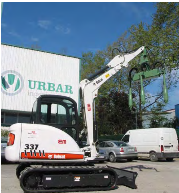
3 VH-15 en retroexcavadora Bobcat 337.