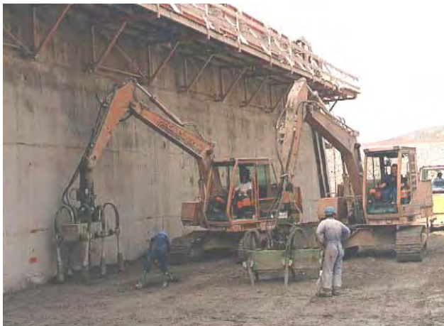
2 CASE POCLAIN 688 con 6 VH-15.