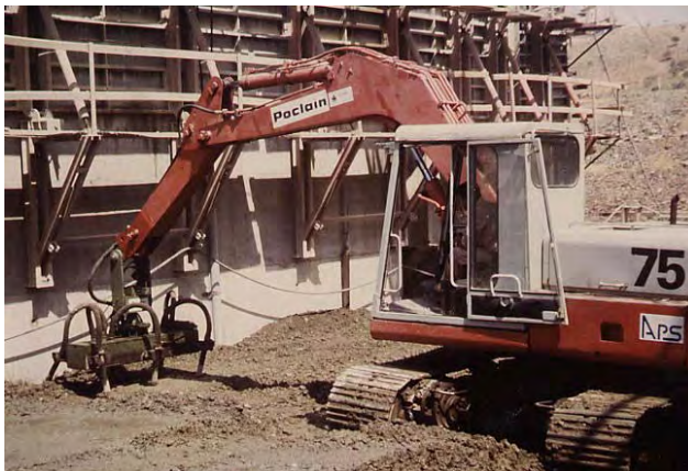
Poclair 75 con 6 vibradores.