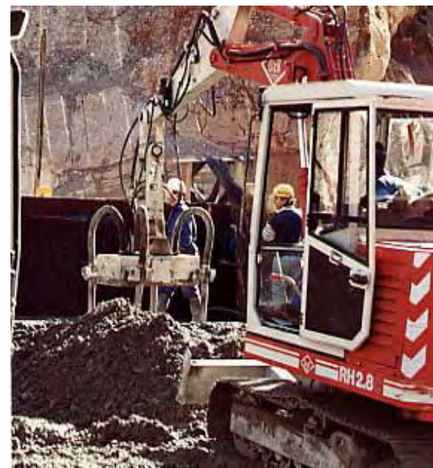
O&K RH2.8 equipada con 4 VH-15.