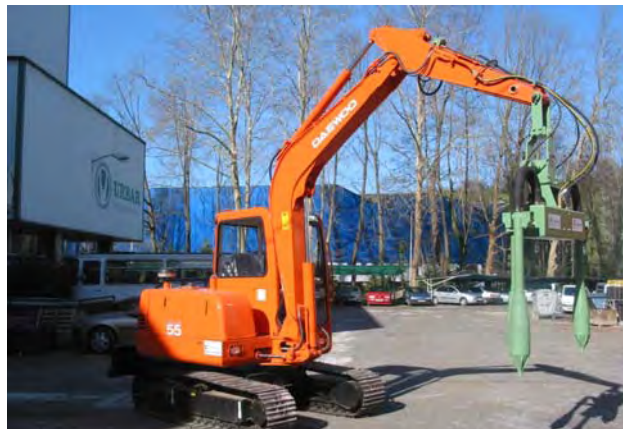
3 VH-15 sobre DAEWOO SOLAR 55.