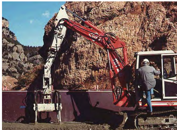
O&K RH2.8 equipada con 4 VH-15.