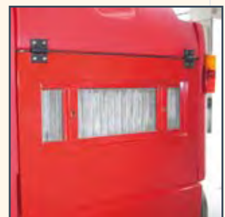
FILTRO A TASCHE FILTROS DE BOLSA FILTRES À POCHEs