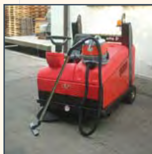
ASPIRAPOLVERE ASPIRADORA ASPIRATEUR