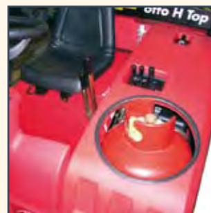
IMPIANTO GPL INSTALACIÓN LPG INSTALLATION GPL