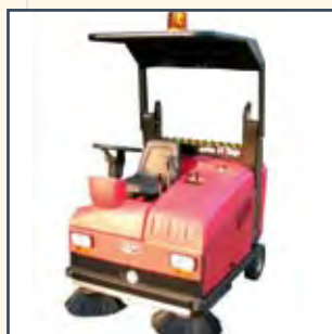
TETTUCIO TECHO TOIT DE PROTECTION