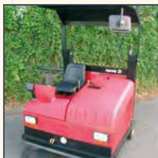
OMOLOGAZIONE STRADALE (NOVE D) HOMOLOGACIÓN PARA CIRCULACIÓN VIAL (NOVE D) HOMOLOGATION ROUTIÈRE (NOVE D)