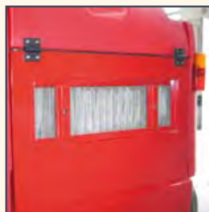
FILTRO A TASCHE FILTROS DE BOLSA FILTRES À POCHES