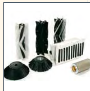
SPAZZOLE E FILTRI ASSORTITI CEPILLOS Y FILTROS SURTIDOS BROSSES ET FILTRES ASSORTIS