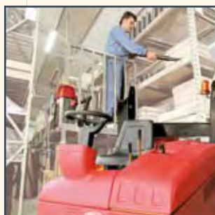
ASPIRAPOLVERE ASPIRADORA ASPIRATEUR