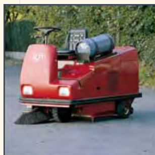
IMPIANTO GPL INSTALACIÓN LPG INSTALLATION GPL