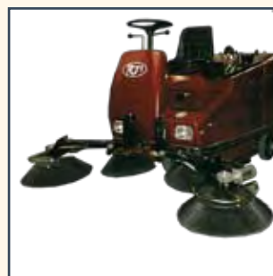
3 E 4 SPAZZOLA LATERALE 3 Y 4 CÉPILLO LATERAL 3 ÈME ET 4 ÈME BALAI LATÉRAL