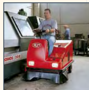
CONVOGIATORE POLVERE ENCAMINADOR DE POLVO CONVOYEUR DE POUSSIÈRE