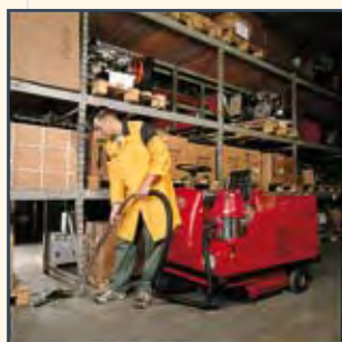
ASPIRAPOLVERE ASPIRADORA ASPIRATEUR