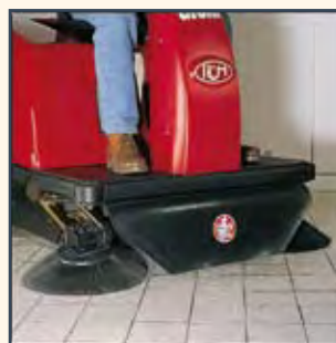
CONVOGIATORE POLVERE ENCAMINADOR DE POLVO CONVOYEUR DE POUSSIÈRE