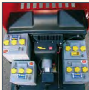
NO.4 BATTERIE 6V-180AH (5H) - (E) 4 BATERÍAS 6 V-180 AH (5H) 4 BATTERIES 6 V-180 AH (5H)