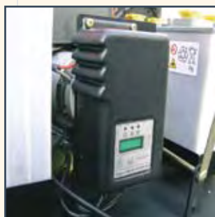
CARICA BATTERIE ON-BOARD CARGADOR DE BATERÍA INCORPORADO CHARGEUR DE BATTERIE EMBARQUÉ