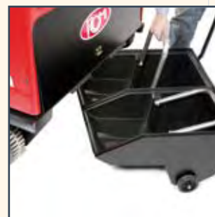
CASSETTI PER CONTENITORE RIFIUTI PEQUEÑOS CUBOS PARA CONTENEDOR DE RESIDUOS SEaux POUR BAC DE DÉCHETS