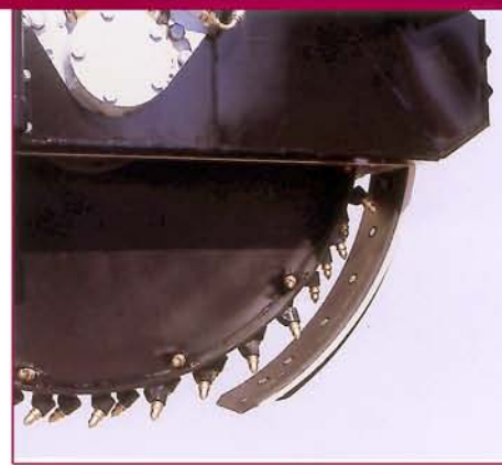
▲ Opcional / Optional Dispositivo vaciado zanja hidráulico Hydraulic trench cleaning device