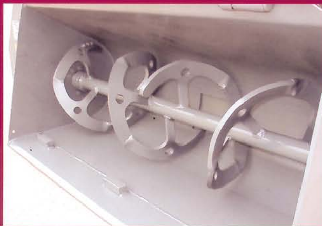
▲ Detalle eje mezclador Mixing axle detail