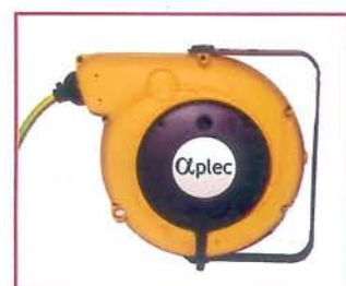
▲ Enrollador eléctrico - opción Electric cable reel - optiono