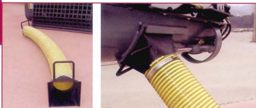
▲ Tubo de vaciado para encofrados Discharging tube