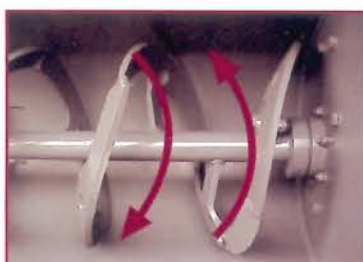
▲ Rotación eje en ambos sentidos Axle rotation in both senses