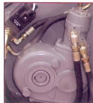
▲ Transmisión por reductor Gearbox system