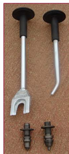
▲ Llaves y Picas Keys and tools

Modelos, datos técnicos e ilustraciones sujetas a cambios sin previo aviso. Models, specifications and illustrations are subject to change without notice.