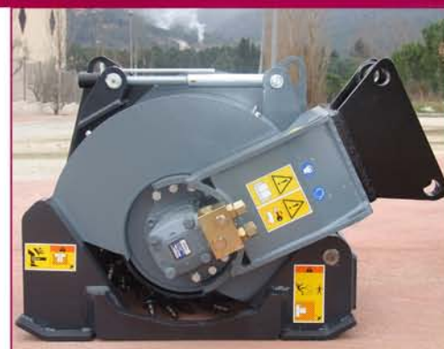
▲ Soporte basculante que permite fresar en cualquier superficie (horizontal, vertical e inclinada) Swinging suport that allows to plane and cutting any surface (horizontal, vertical and inclined)