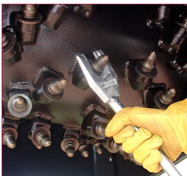
▲ Tambor y llave para extraer las picas Drum and key to takeout the tools