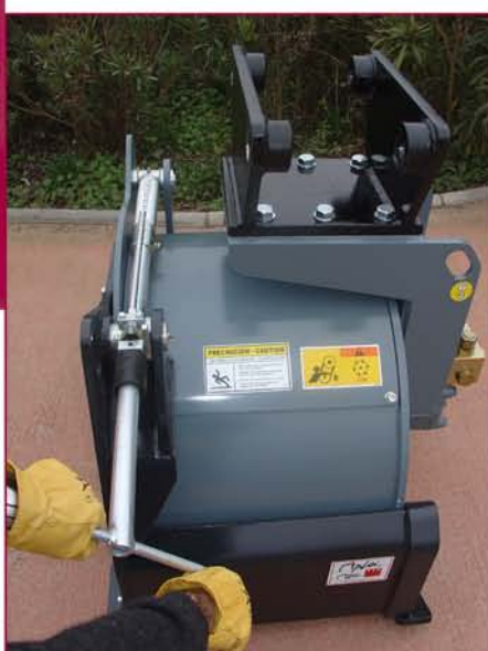
▲ Control de profundidad mecánico Mechanical depth control