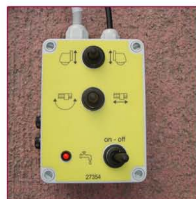
▲ Botonera control de movimientos Switch controls for movements