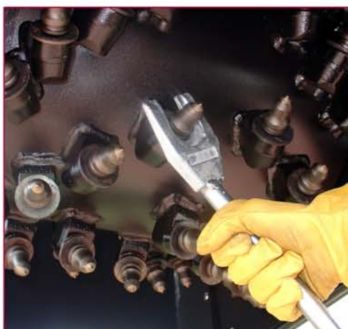
▲ Tambor y llave para extraer las picas Drum and key to takeout the tools