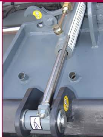
▲ Controles de profundidad e inclinación lateral mecánicos (hidráulicos opcionales) Mechanical depth control and Tilt (hydraulic optional)