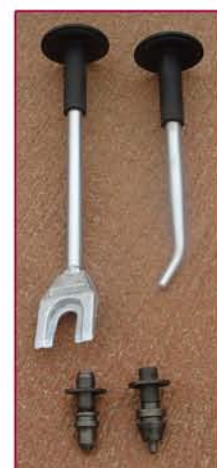
▲ Llaves y Picas Keys and tools