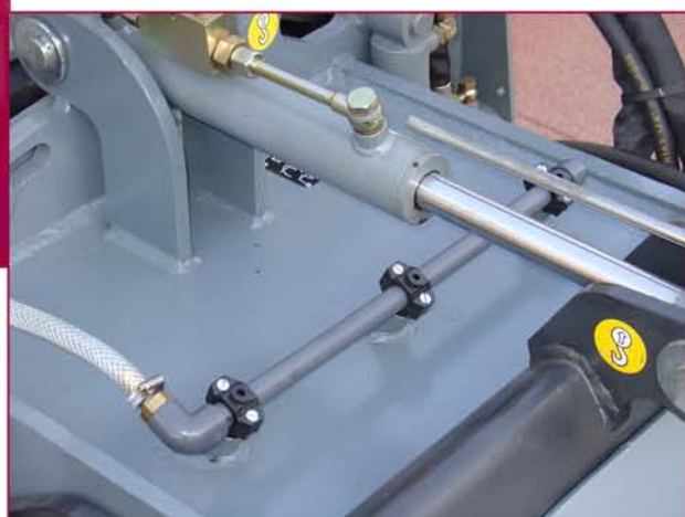
▲ Sistema de riego (opcional) Sprinkler system (option)