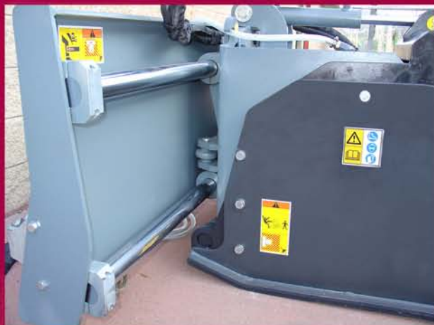
▲ Desplazamiento lateral hidráulico Hydraulic sideshift