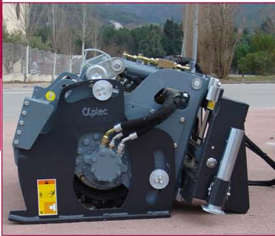
▲ Patín con autonivelación independiente Self levelling of both slides