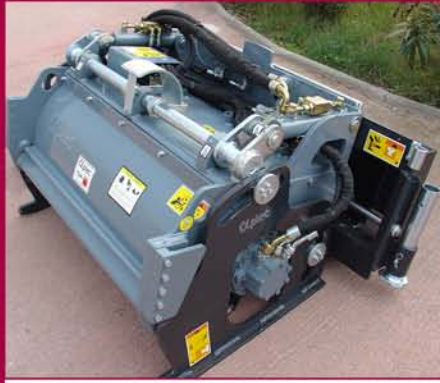
▲ Desplazamiento lateral hidráulico Hydraulic sideshift