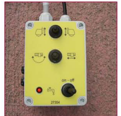
▲ Botonera control de movimientos Switch controls for movements