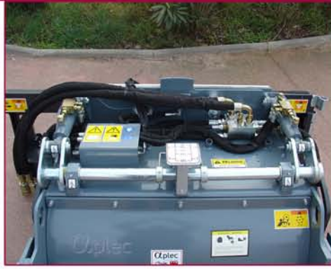
▲ Controles de profundidad e inclinación lateral mecánicos (hidráulicos opcionales) Mechanical depth control and Tilt (hydraulic optional)