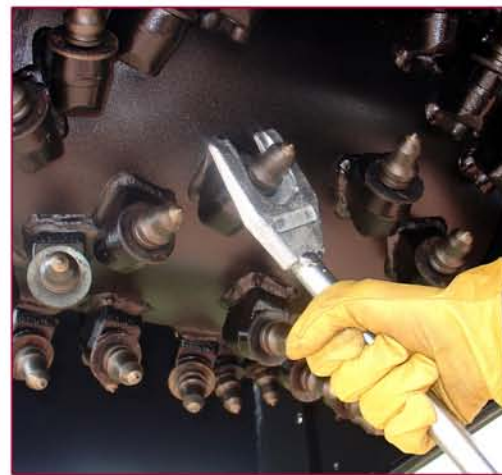
▲ Tambor y llave para extraer las picas Drum and key to takeout the tools