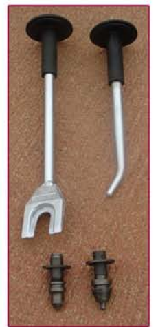
▲ Llaves y Picas Keys and tools