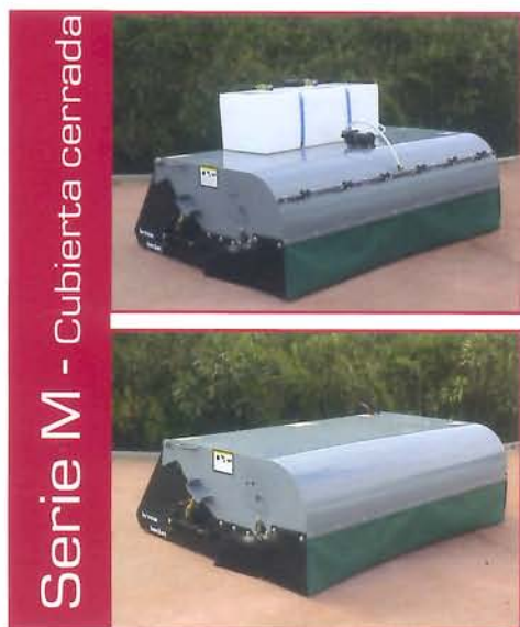
Serie M - Cubierta cerrada