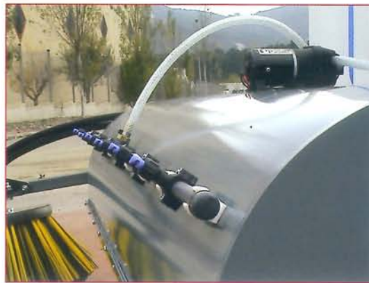
▲ Sistema de riego - opción Sprinkler system - option