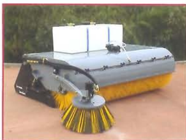
Serie M - Cubierta abierta