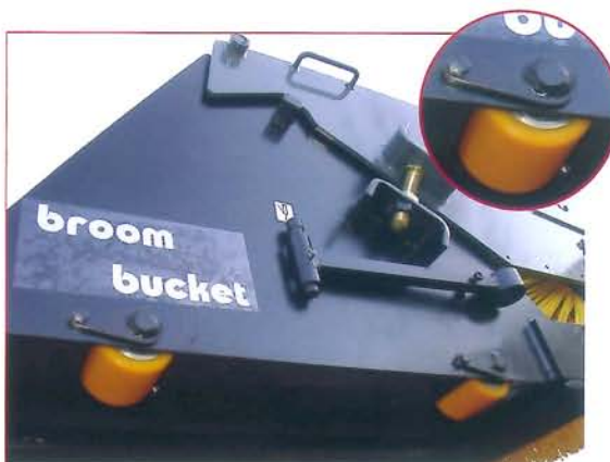
▲ Ruedas deslizamiento cuchara - opción Wheels for sliding the bucket - option