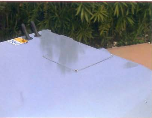
▲ Tapa acceso motor hidráulico Cover to accede to the hydraulic motor