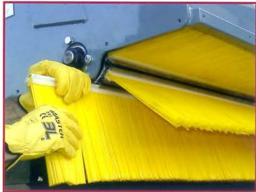
▲ Sistema rápido cambio cepillo central Fast system for changing the central brush