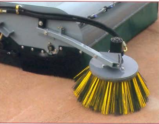
▲ Sistema de cepillo lateral - opción Side sweeper system - option

The broom bucket serves as a collector for different materials. It is also used for charging and distributing them (fill sand in joints and seams, distribute sand, etc). It is very recommended for jobs in public works, building, industry and gardening.