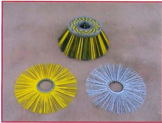
▲ Discos cepillo central y cepillo lateral Discs central brush and side sweeper