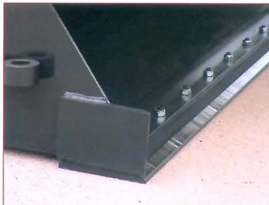
▲ Cuchilla atornillada de doble uso Cutting edge double use