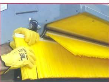
Serie MFS - Fast system