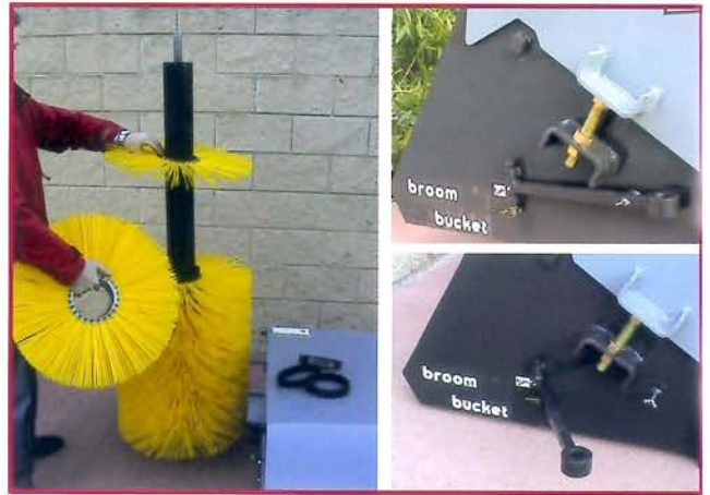
▲ Sistema para facilitar el cambio del cepillo central System for changing the central brush in a easier way