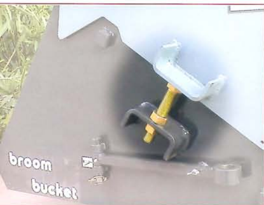
▲ Sistema regulación cepillo central Adjusting system for the central brush