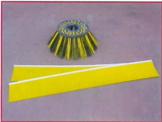
▲ Tiras cepillo central y cepillo lateral Strips central brush and side brush