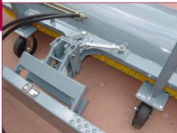
▲ Inclinación lateral regulable (izquierda - derecha) Lateral inclination adjustable (left & right)