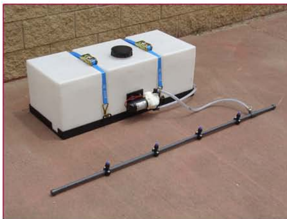
▲ Sistema de riego y soporte deposito (opcional) Sprinkler system and tank support (optional)