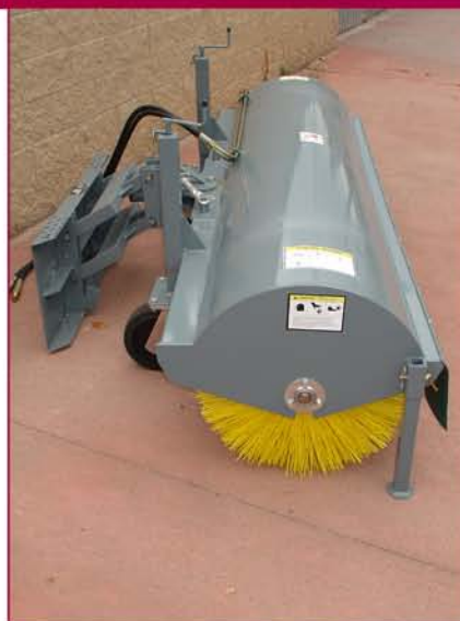
▲ Acoplamiento oscilante adaptation with oscillation