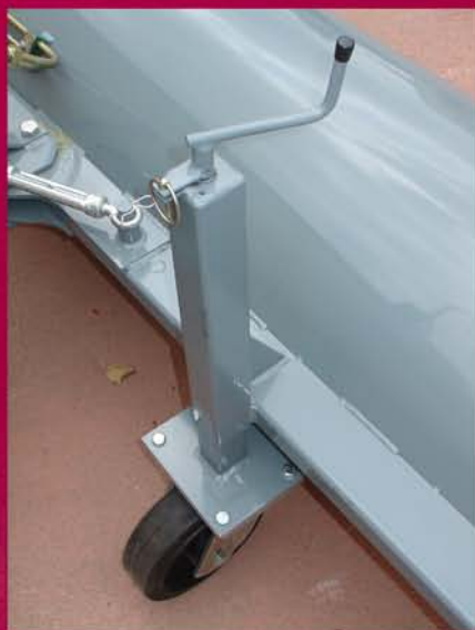
▲ Altura de apoyo regulable Weels height adjustable