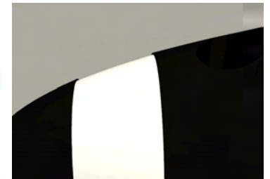
Detalle de la hendidura para la pintura