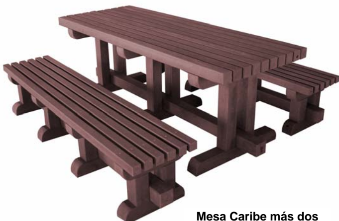
Mesa Caribe más dos bancos Caribe