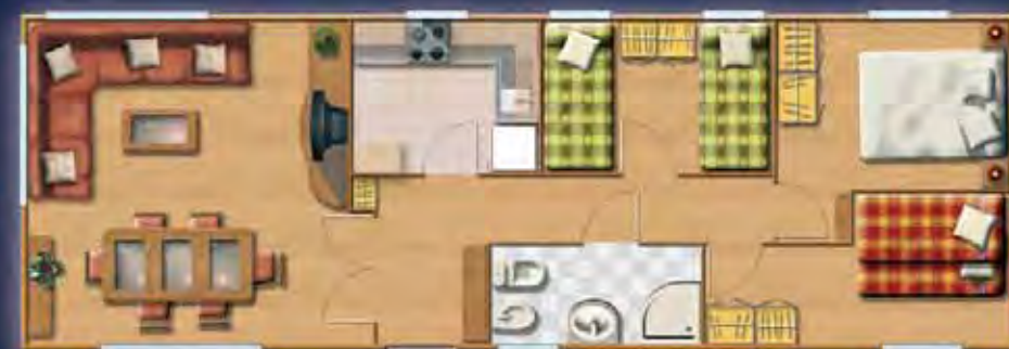
EVEREST plus 12,31 x 4,17 m