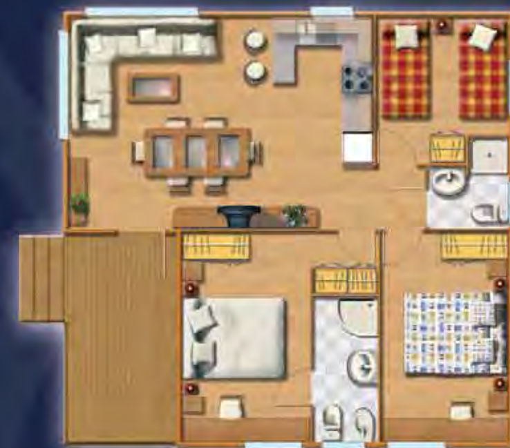
SIERRA DE LA DEMANDA 8,00 x 8,00 m