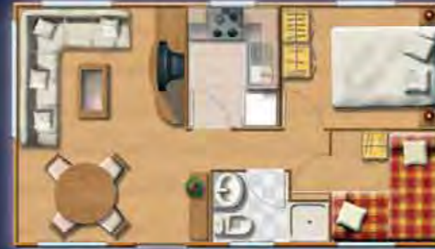
MULHACEN confort 7,36 x 4,17 m