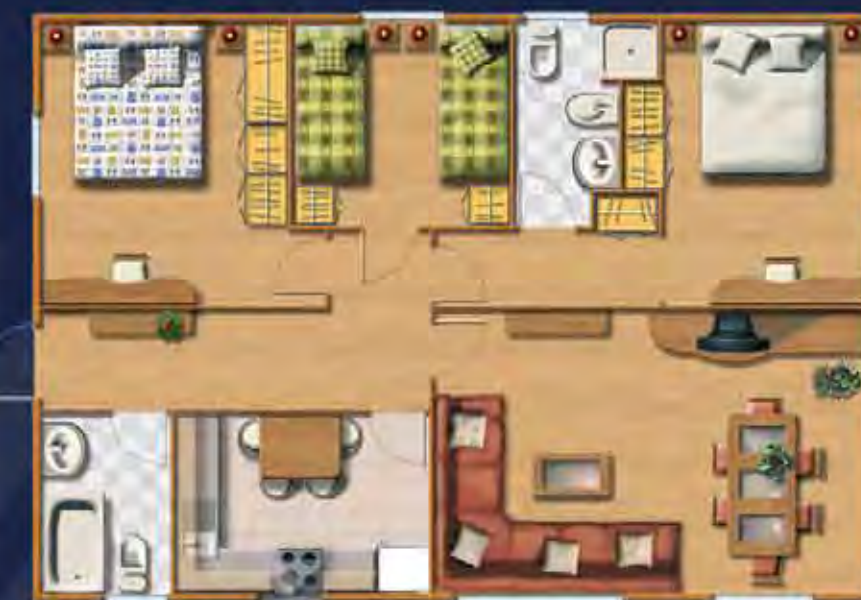
SIERRA NEVADA 10,06 x 7,00 m