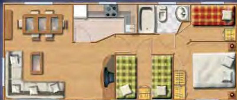
KILIMANJARO 10,06 x 4,17 m