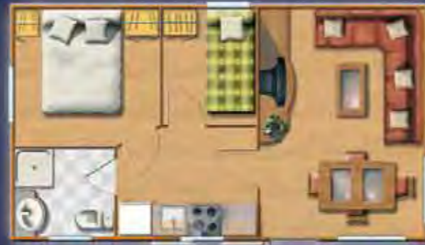
MULHACEN 7,36 x 4,17 m