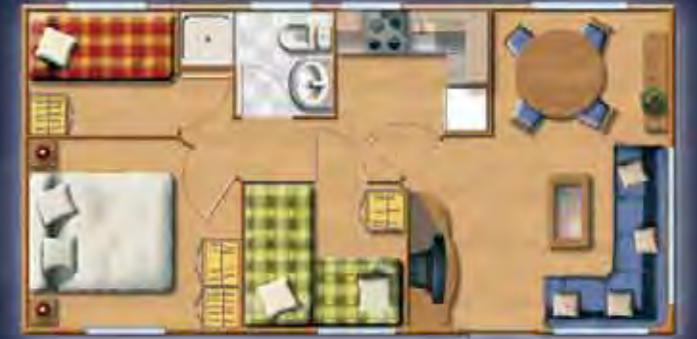
TEIDE 8,26 x 4,17 m