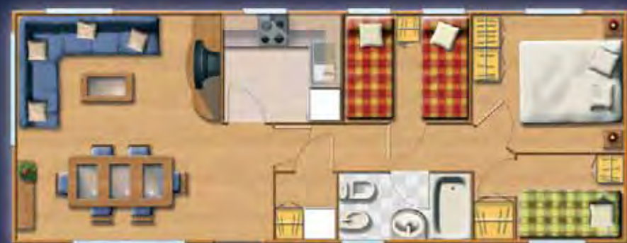
ACONCAGUA 10,96 x 4,17 m