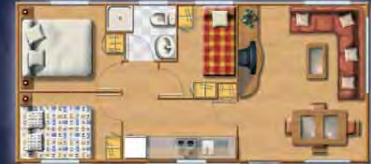
MONTBLANC 2000 9,16 x 4,17 m