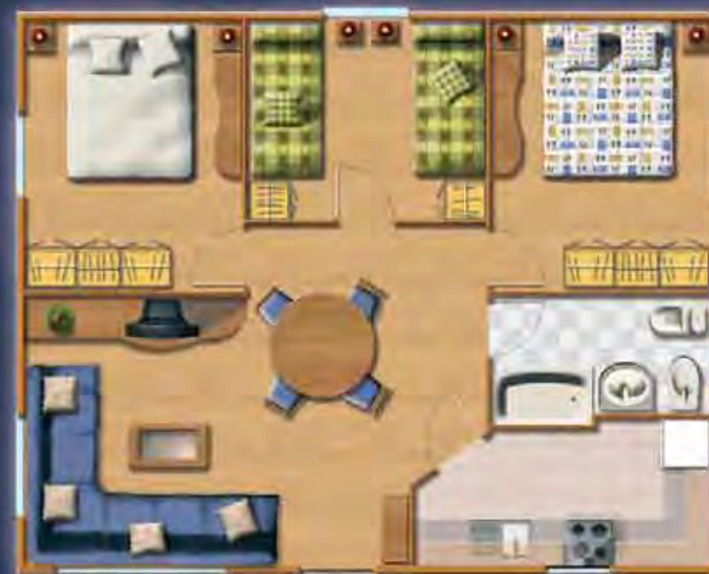
SIERRA MORENA 8,26 x 6,60 m