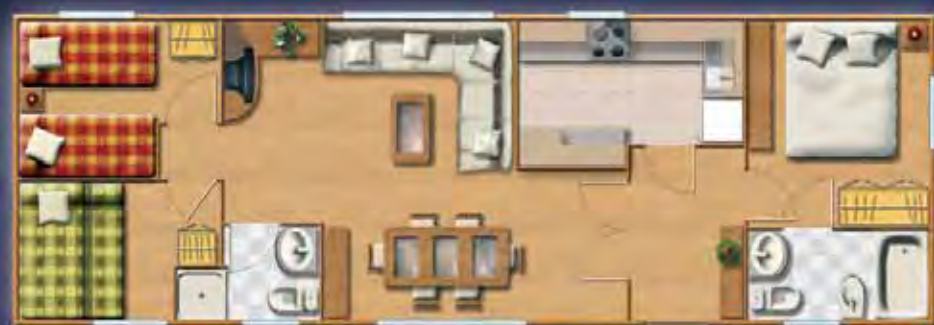
EVEREST confort 12,31 x 4,17 m