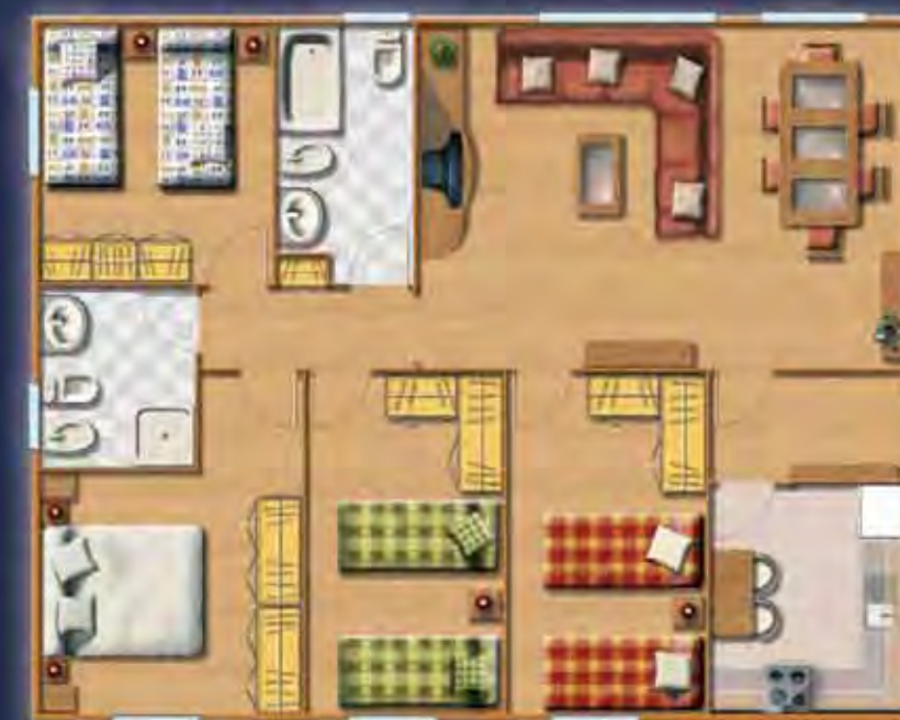
SIERRA DE GREDOS 10,06 x 8,00 m