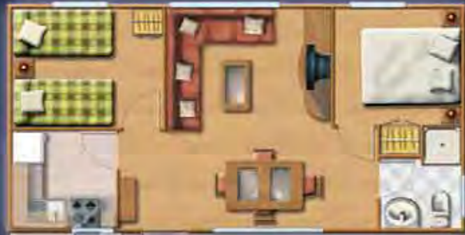
TEIDE confort 8,26 x 4,17 m