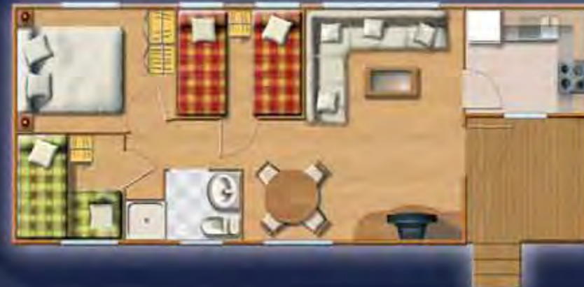
KILIMANJARO solpico 10,06 x 4,17 m