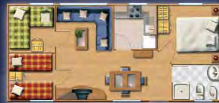
MONTBLANC confort 9,16 x 4,17 m