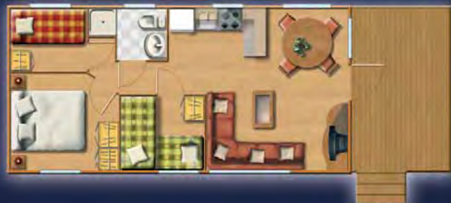
ACONCAGUA terraza 10,96 x 4,17 m