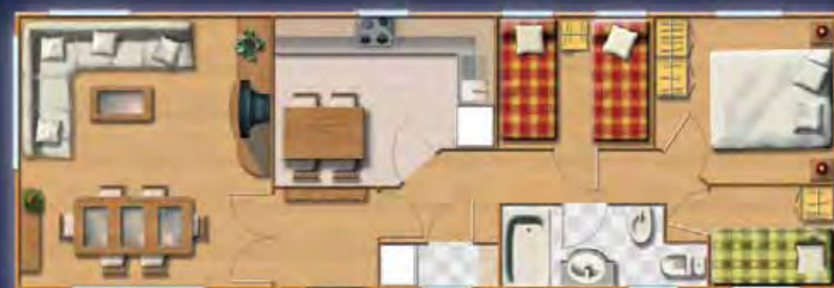
EVEREST 12,31 x 4,17 m