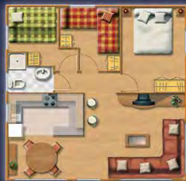
SIERRA DE ATAPUERCA 7,00 x 7,00 m