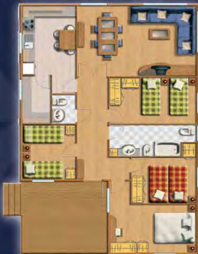
PIRINEOS 12,31 x 8,00 m