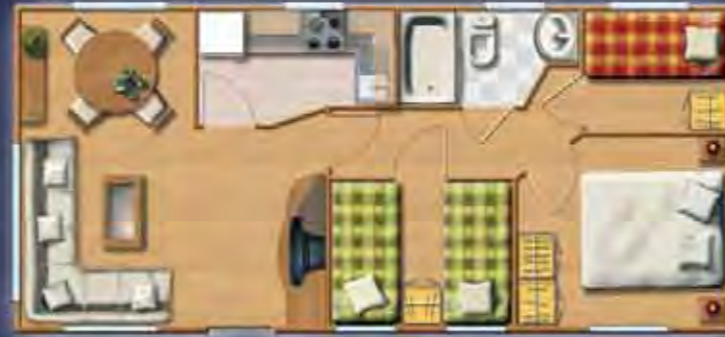
MONTBLANC 9,16 x 4,17 m