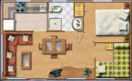
ANETO 6,91 x 4,17 m