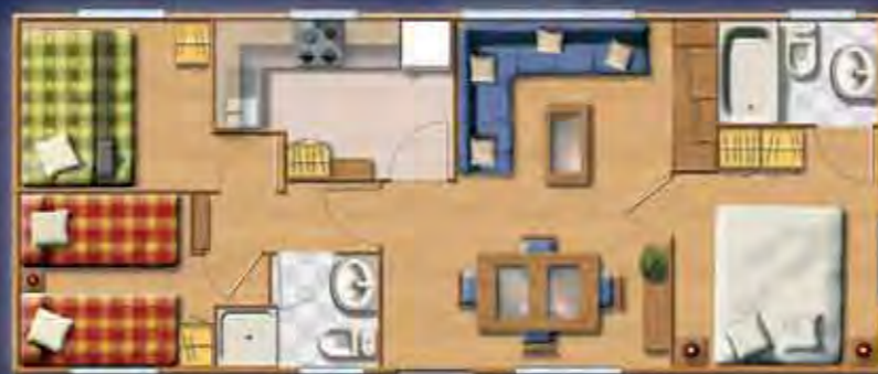
KILIMANJARO confort 10,06 x 4,17 m