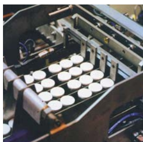
foto: Detalle agrupación de yogures previo a la introducción del producto en la caja. Múltiples opciones y fácil regulación.