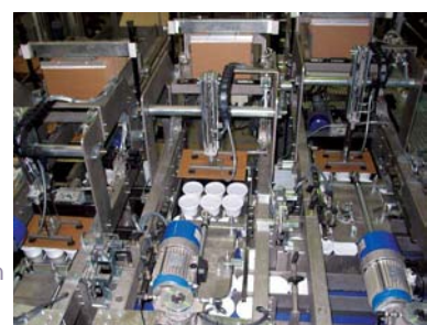
foto: Detalle agrupado de gran producción para tarros.