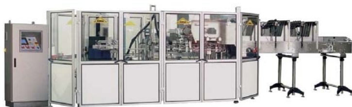
foto: Encajadora DM25.

Se pueden acoplar insertadores de separadores.