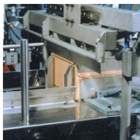
foto: Detalle de la caja llena cerrada. Plegado de la caja exacto. Ecuadrado perfecto. Regulación milimétrica. Compactado sin holguras.

Gama de prestaciones elevadas para el final de línea. Diseño y fabricación propia con materiales de 1ª calidad cumpliendo las Directivas CE.