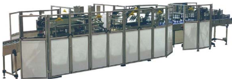
foto: Encajadora DM40.