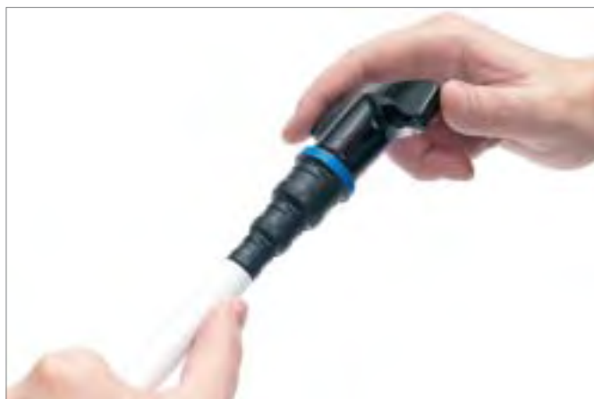
2. Calibrar y biselar