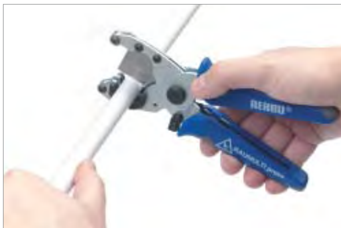
1. Cortar el tubo