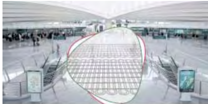
Construcción: soluciones para sistemas de ventana y muros cortina, técnica para edificios y obra civil

Cuando se prevea una aplicación diferente a la descrita en esta Información Técnica, el usuario debe consultarlo previamente a REHAU y obtener, antes de la aplicación, una autorización expresa por escrito por parte de REHAU. En caso de no cumplir con este requisito, la aplicación pasa a ser de la exclusiva responsabilidad del usuario. La aplicación, la utilización y el manejo de los productos se encuentran, en este caso, fuera de nuestras posibilidades de control. Si, a pesar de ello, hubiera lugar a asumir una responsabilidad, ésta queda limitada, para todos los daños, al valor de la mercancía suministrada por nosotros y empleada por ustedes. Toda aplicación distinta a las descritas en esta Información Técnica invalida cualquier derecho de reclamación que pudiera estar amparado por la garantía establecida.