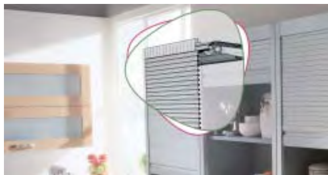
Industria: diseño de muebles, técnica de tubos flexibles y perfiles, compound, industria de los electrodomésticos