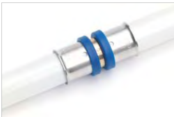
3. Introducir el accesorio RAUMULTI press por completo en el tubo