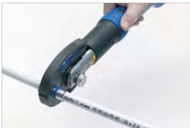
4. Unir mediante presión con la herramienta RAUMULTI press