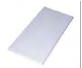
Plancha de relleno