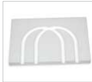
Plancha de transición