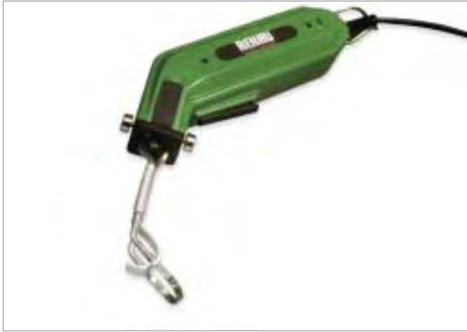
Cortador de guías para tubos