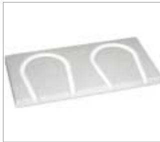
Plancha para curvas VA 12,5