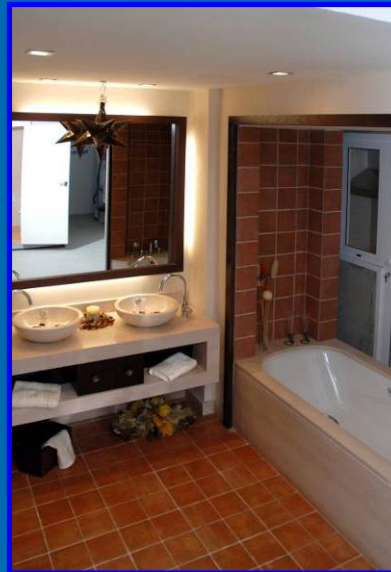
Baño Piloto Suite Hotel 5* (Mojácar)