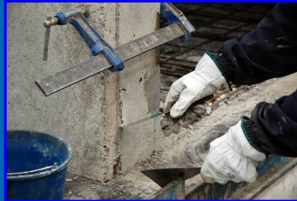
Montaje de Paredes

Respetando siempre la seguridad en el hormigonado y los tiempos de secado , controlados electrónicamente, nuestro sistema de producción alcanza los 12 módulos/día .