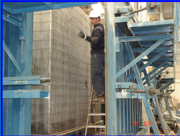
Preparación del Molde

Aunque se trate de un proceso industrializado, cada módulo se prepara y revisa individualmente tratando de ofrecer la mejor garantía de calidad a nuestros clientes.