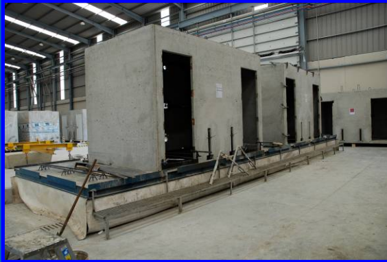
Mesa de Secado

Respetando siempre la seguridad en el hormigonado y los tiempos de secado , controlados electrónicamente, nuestro sistema de producción alcanza los 12 módulos/día .