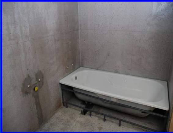
Instalación de Sanitarios