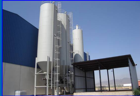
Silos y Tolva de Almacenamiento de Cemento