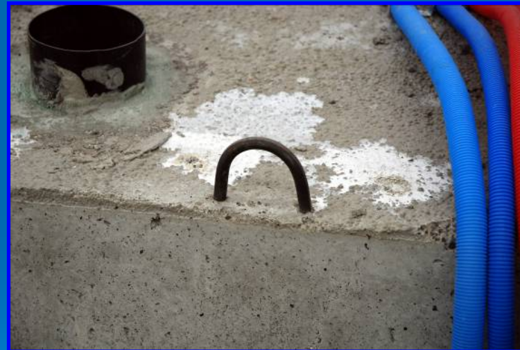
Ganchos de Levantamiento

HYDRODISEÑO , prepara cada módulo para que su transporte se realice en condiciones óptimas , facilitando la carga y descarga a través de Ganchos de Levantamiento insertados en el hormigón.