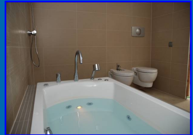
Suite Hotel (Murcia)