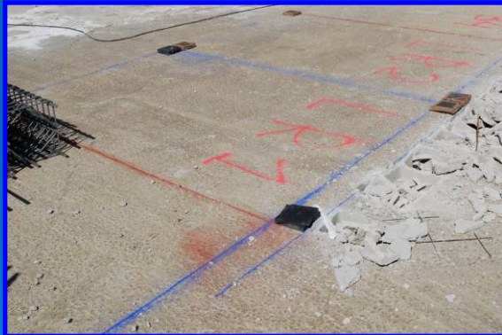
Replanteo sobre Forjado

Durante la 1ª puesta en obra, personal cualificado de HYDRODISEÑO, controlará e indicará en todo momento el proceso de descarga e instalación .