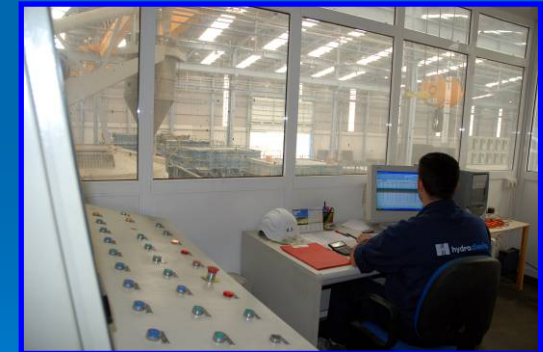
Sala de Control

La industrialización del proceso permite a nuestro cliente conocer en todo momento los plazos de ejecución y entrega de su proyecto.