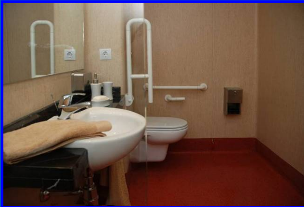
Baño Adaptado Minusválidos Hospital de Manises (Valencia)