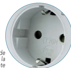
Sistema de bloqueo a la corriente