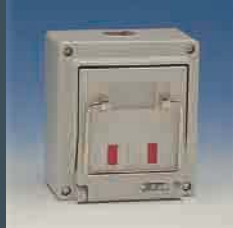
CAJAS SECCIONADORAS INTERRUPTORES INDUSTRIALES CORTACIRCUITOS