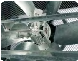
Sistema automático de apertura de la persiana